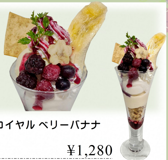
スノーロイヤル ベリーバナナ

チョコチップと爽やかなミントを合わせたチョコミントアイスに、ザクザククランチやパリパリチョコを添えた、食感が楽しいパフェです。