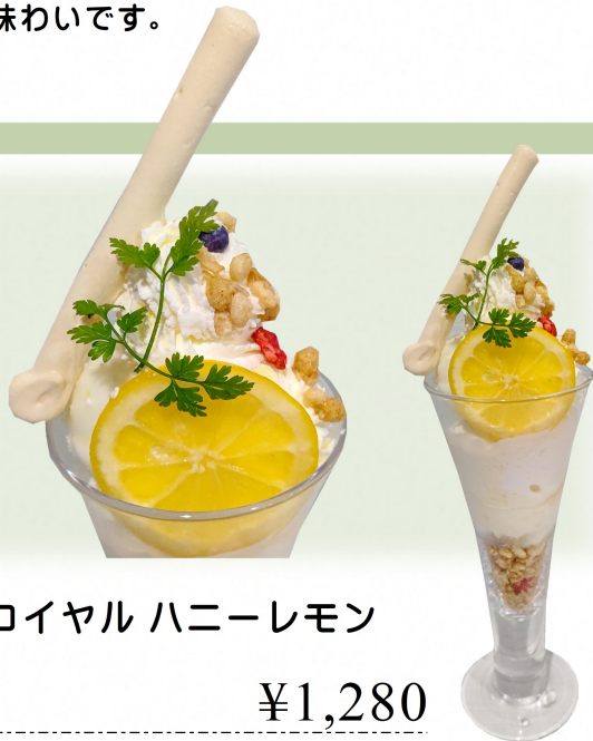
スノーロイヤル ハニーレモン

北海道赤肉メロンを使ったゼラートに「スノーロイヤル」、自家製シフォンを合わせて。夏だけの贅沢な味わいです。