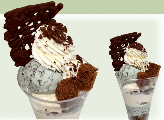
スノーロイヤル チョコミント

※ はちみつを使用しております。 1歳未満の乳児のお召し上がりはご遠慮ください。