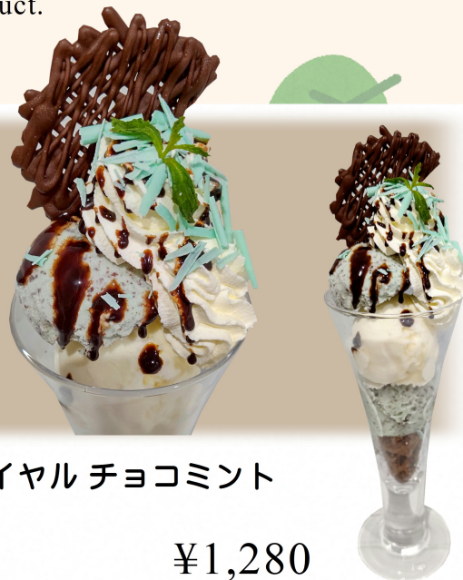
スノーロイヤル チョコミント

北海道メロンゼラートに「スノーロイヤル」を合わせ、フレッシュな赤肉メロンを添えて。夏だけの贅沢な味わいです。